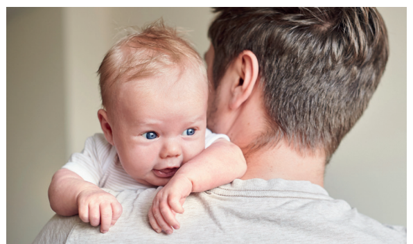
Handbuch und Schlusstabelle